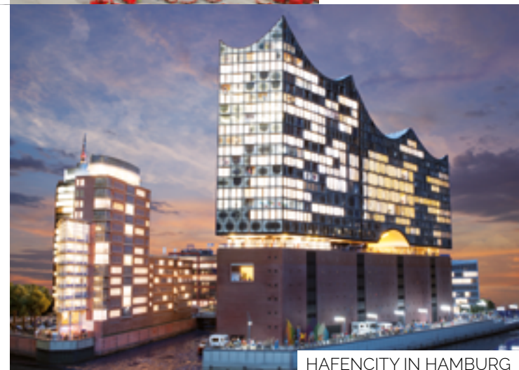
HAFENCITY IN HAMBURG