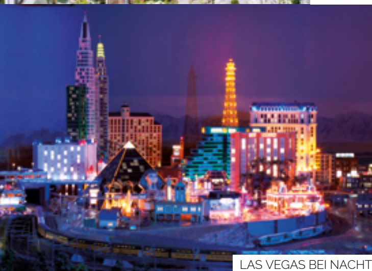
LAS VEGAS BEI NACHT