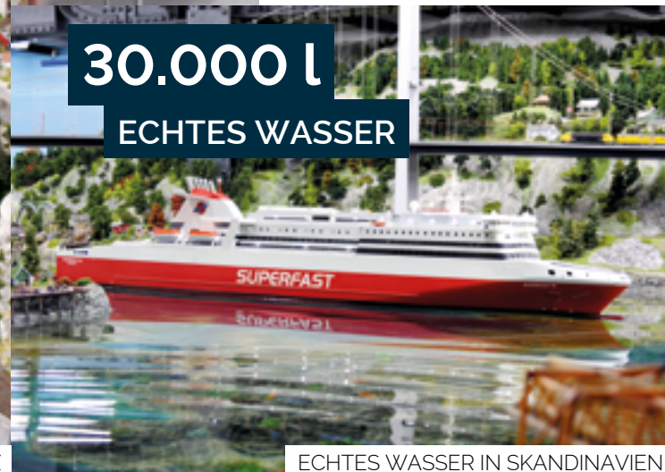
ECHTES WASSER IN SKANDINAVIEN