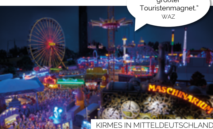
KIRMES IN MITTELDEUTSCHLAND