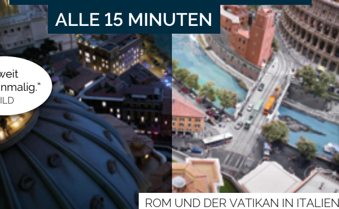
ROM UND DER VATIKAN IN ITALIEN