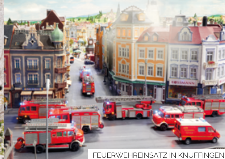
FEUERWEHREINSATZ IN KNUFFINGEN