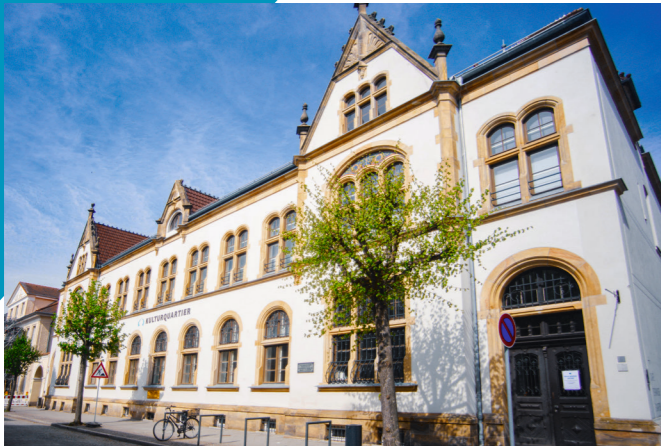
Das ehemalige Kaiserliche Postamt ist heute das Eingangsgebäude zum Kulturquartier.